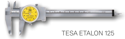
TESA ETALON 125