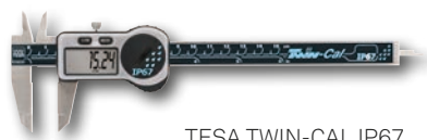
TESA TWIN-CAL IP67